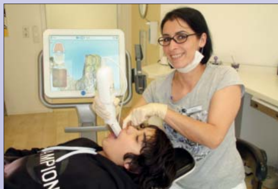
Itero-Scanner im Einsatz. In wenigen Minuten wird per Lichtlaser der gesamte Mundraum mit Zähnen im Bildschirm erfasst, ganz ohne Abdruck!

der Seite in den Wangen. Die sogenannten winzigen Attachments (Abb. rot) ersetzen die Brackets der festen Zahnspange. Diese optimierte Behandlung ermöglicht zwei Behandlungsschritte auf einmal: die der Plattenapparaturen und die der festen Zahnspange. Dies ist sowohl zeiteffizient als auch zahnschonend, da alle erforderlichen Schritte optimal aufeinander abgestimmt werden können. Für das Gelingen und die Programmierung dieser Therapieschritte ist alleine der Behandler verantwortlich. Hier verfügt Prof. Dr. Polzar über einen sehr großen langjährigen Erfahrungsschatz und kann sein Können zum Wohle der jungen Patienten einsetzen.