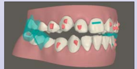
Komplexe Behandlungsplanung: Die Wings (grün) ersetzen die herausnehmbare Zahnspange und die Attachments (rot) die feste Zahnspange

versicherung übernommen. Gesetzlich Versicherte müssen diese Kosten selbst tragen. Hierfür sind Ratenzahlungen von 150 bis 200 Euro über mehrere Monate möglich. Das Finanzamt erstattet einen Teil der Aufwendungen.