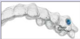
Invisalign®-Schiene mit blauen Indikatorpunkten

Die Invisalign®-Therapie besteht aus einer Serie von nahezu unsichtbaren und herausnehmbaren Schienen, die in der Regel alle zwei Wochen gewechselt werden und durch regelmäßige Anpassung Zahnbewegungen ähnlich wie bei einer festen Zahnspange ermöglichen.