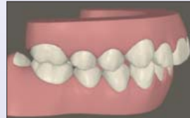
Zu Behandlungsbeginn kann dem Patienten direkt eine Vorher-Nachher-Simulation der geplanten Behandlungskorrektur gezeigt werden