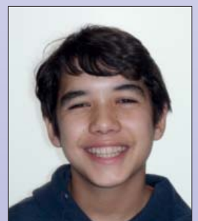
Ein glücklicher Patient mit fast unsichtbarer Zahnspange im Mund